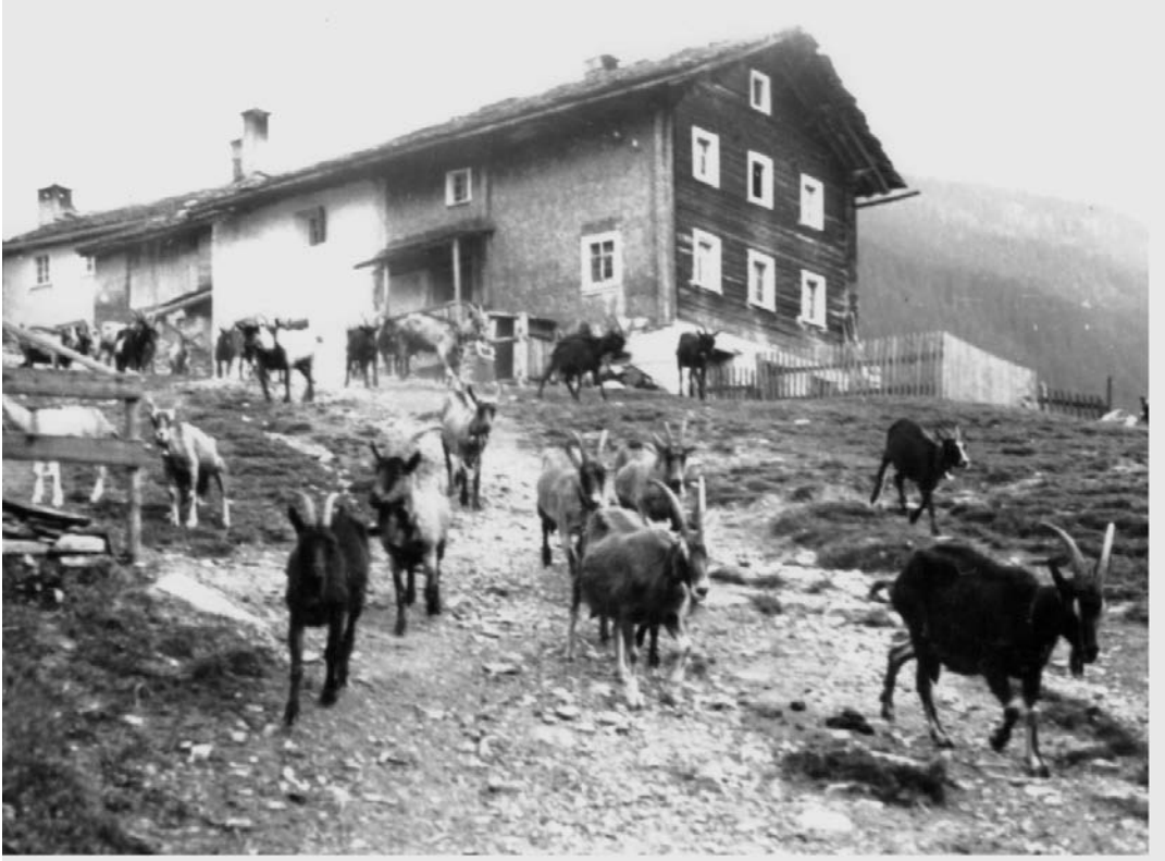
Ziegen kehren abends ins Dorf zurück.

Weil dieses seit anfangs der 50er Jahre nicht mehr genutzt wird, versuchte die Gemeinde Vals eine Ablösung zu Gunsten eines Sömmerungsrechtes für vier Rinder. Die Gemeinde Flims trat auf dieses Angebot aber nicht ein. Die grossen Bauernfamilien hielten im Sommer eine Heimkuh, insgesamt waren es jeweils 20 - 30 Kühe, die Hirtenknaben täglich auf die Gemeindeallmende Richtung «Zorts» auf die Weide brachten. Überschüssige Milch wurde an Private verkauft. Letztmals wurden 1949 Heimkühe gehalten. Die Hotels Adula und Therme hielten eigene Kühe, die in den «Badstauden» ihre Weide fanden.