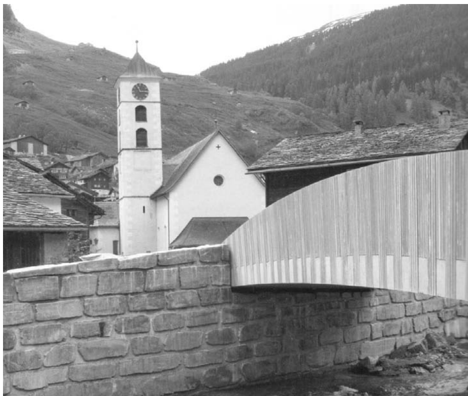
Neue Dorfbrücke mit Verbindung in Hochwasserschutzbaute

Projektiert wurde die neue Dorfbrücke durch den bekannten Brückenbauer Jürg Konzett aus Chur, ausgeführt durch die Baufirma Valaulta/Berni, Rueun. Die Brücke ist in die Hochwasserschutzbaute integriert und ergibt eine Einheit von hoher Ingenieurskunst und grosszügiger Gestaltung mit Valser Steinplatten. In Beziehung zu den anliegenden einfachen Wohnhäusern und dem malerischen Dorfplatz wird die Brücke als wuchtig, dominant wahrgenommen.