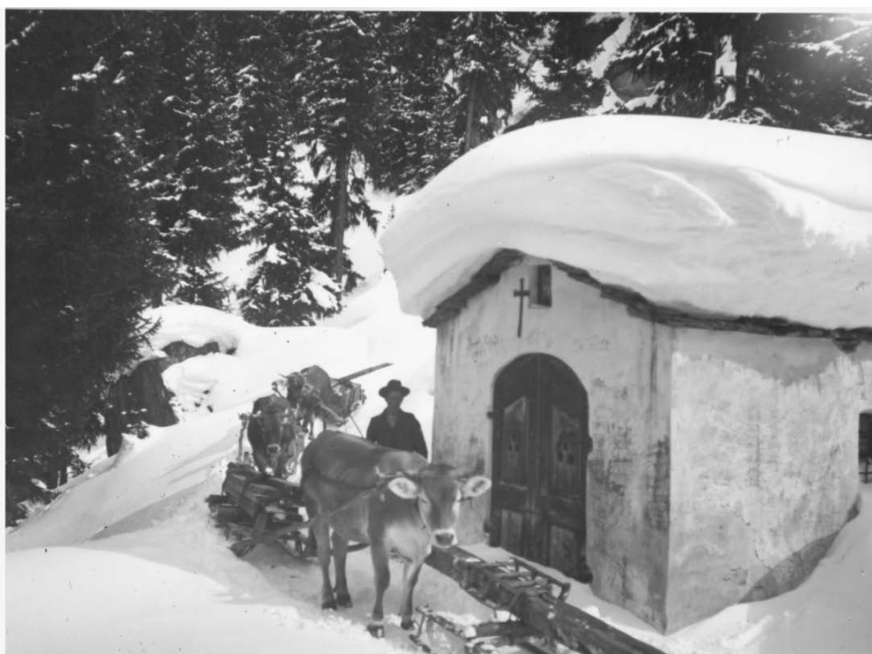
«Menni» beim alten «Calvaria-Chappeli»

Die Viehwirtschaft in Vals verläuft nach dem dreistufigen Betrieb. Zwischen Talgütern und Alp schiebt sich das Maiensäss ein.