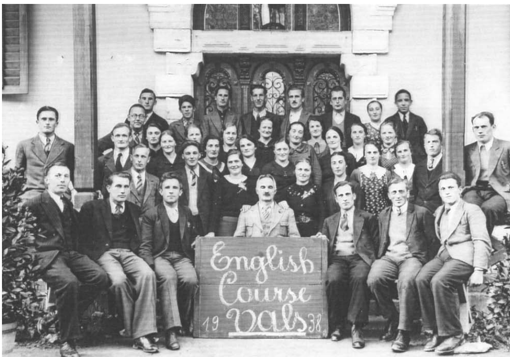
Englischkurs für Hotelangestellte