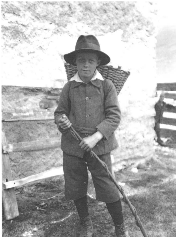
Hüterbub mit Peitsche

Für das Grossvieh gestaltete sich der Jahresablauf folgendermassen: Im Frühling zog man um den 20. Mai mit dem Vieh auf die Maiensässe, wo die Tiere die Gemeindeall-