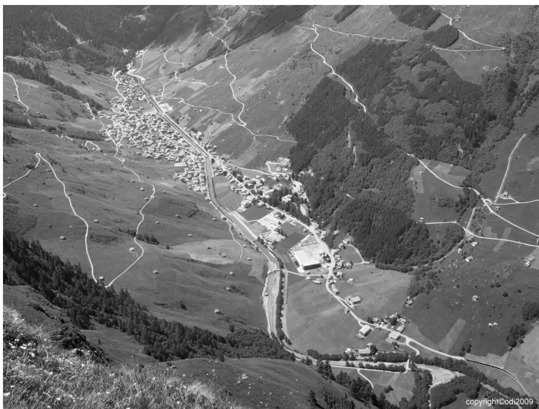
Neue Wege erschliessen das Kulturland

Aufgrund der Gebietsgrösse von über 400 ha Land unterstand die Gesamtmelioration der Umweltverträglichkeitsprüfung. Grundlage für die Beurteilung waren die Inventarisierung und Kartierung von Flora und Fauna. Sie bildeten die Basis, um Konflikte mit den geplanten Meliorationsmassnahmen wie Wege zu beurteilen. Es wurden auch Bewirtschaftungsverträge mit den Landwirten abgeschlossen, damit ökologisch wertvolle Flächen entsprechend bewirtschaftet werden. An Wegbauten sind 9.9 km Neubauten und 9.3 km Ausbau/Sanierung vorgesehen.