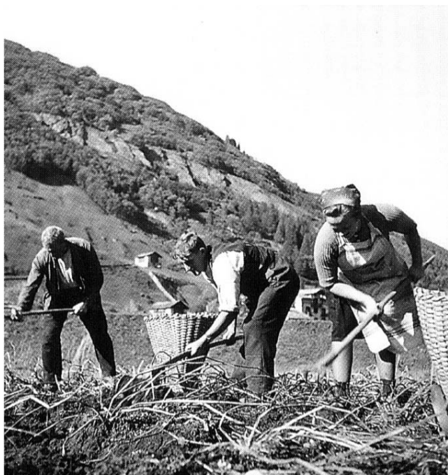
Beim Kartoffelgraben 1944

Die Wohnbevölkerung unseres Dorfes veränderte sich von 1808, 707 Einwohner, bis 1920, auf 786 Einwohner, nur gering. Dies ist eine Zunahme um 11 %. Der grösste Teil der Bevölkerung arbeitete in der Landwirtschaft. Ihr Anteil betrug im Jahre 1850 80 %, 1900 66 % und 1950 waren es noch 46 %. Heute sind 16 % in der Land- und Forstwirtschaft tätig. Tagelöhner und Handwerker hielten zum Nebenerwerb und Selbstversorgung von Milch und Fleisch einige Ziegen und Schafe. Die Ernährung war in früheren Zeiten einseitig. Die Mahlzeiten bestanden vor allem aus reichlichen Mengen Milch, Käse, Zieger, Mehlspeisen und luftgetrocknetem Fleisch. Die Spanier hatten die Kartoffel Mitte des 16. Jh. von Südamerika nach Europa gebracht. In Graubünden setzte sie sich erst nach den Hungerjahren 1771 - 1773 zögerlich durch. Sie galt bis daher als ungesunde, ärmliche, reizlose Kost.