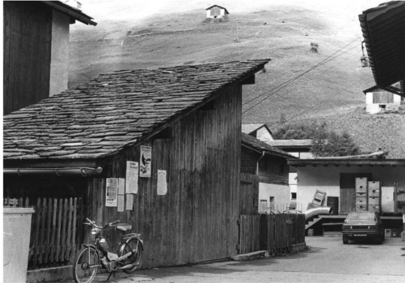
Talstation Seilbahn Alp Leis

Mitte der 40er Jahre reifte der Plan, eine Transportbahn auf die Leisalp zu bauen. Nach vierjährigem Kleinkrieg unter den Alpinhabern konnte 1949 ein Projekt mit Kostenberechnung unterbreitet werden, welches Zustimmung fand und gebaut wurde. Nebst Berg- und Talstation, letztere in unmittelbarer Nähe der Sennerei, mussten vier Seilstützen erstellt werden. Der Antrieb erfolgte durch einen 12 PS-Elektromotor. Die Baukosten von 70'000 Fr. wurden wie folgt finanziert: Bund und Kanton gewährten Subventionen von je 20 % der Baukosten. Die Gemeinde trug Fr. 5'000 bei, die Berghilfe Fr. 4'800. Der Verkehrsverein leistete einen Beitrag von 5 Rp. je Logiernacht. Die Restfinanzierung lag bei der Alpgenossenschaft. Die Alp verrechnete Transportkosten von 9 Rp. pro lt. Milch oder kg. Das tragische Lawinenunglück von 1951 kam der Genossenschaft zu gute, denn das Baumaterial und Betonelemente für die Lawinenverbauungen «An der Matta» wurden grösstenteils mit der Seilbahn transportiert. Dank diesem Grossauftrag konnte die Bahn innert kurzer Zeit amortisiert und sogar Rückstellungen für den Sennhüttenumbau gemacht werden.