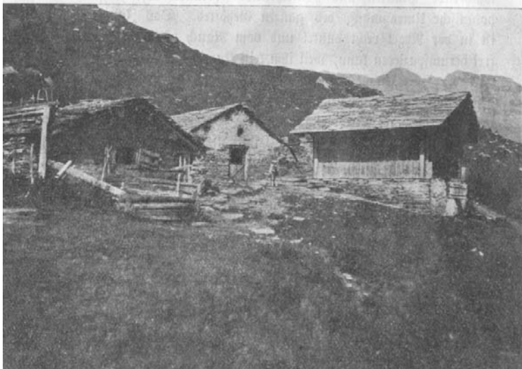
Einzelsennerei «Süwaboda» Peiltal, Alp Selva

«Jeder Bauer hat auf der Alp seine eigene <Rustig>, (Gebäude) also mit dem Haus im Dorf und demjenigen im Maiensäss drei Wohnungen mindestens. Solche Rustigen sind