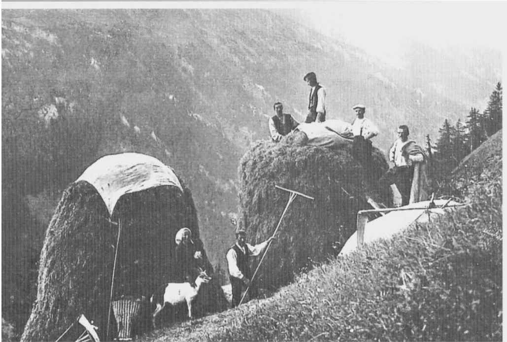
Triste mit Heuer/innen, «Mattgeiss» und Gerätschaften

In der Regel wurde es anfangs Juli, bis mit dem Heuen begonnen werden konnte. Vor allem bedingt durch die Erbteilung, aber auch die Topographie, gab es kaum arrondiertes Land. Jeder Bauer hatte eine grosse Anzahl Parzellen zu bewirtschaften, verteilt auf das ganz Tal. Das Heu wurde in Heutücher eingebunden, auf die Ställe getragen, die im Bereich der Parzellen standen und dort im Winter auch ausgefüttert. So stieg man im Laufe des Sommers die Talhänge empor bis zu den Maiensässen. Kurzfristig nahm dann die Bauersfamilie im Maiensäss Wohnsitz. Die Milchversorgung gewährleisteten jetzt «d Mattgeiss», die die Familie begleiteten. Ende August wurden noch die Heuberge gemäht. Das Gras wurde in den Heudächern gelagert, wenn keine vorhanden, zu «Trischta» aufgetürmt.