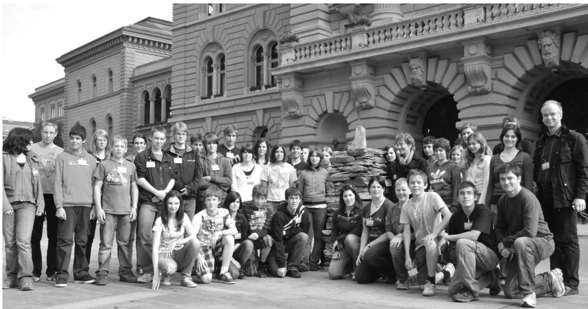
Die Oberstufenschüler mit Bundesrätin E. Widmer-Schlumpf vor dem Bundeshaus

26. Übergewichtigkeit ist bei Menschen aller Altersstufen zu finden. Vorwiegend wird sie auf mangelnde Bewegung und unausgewogene Ernährung zurück geführt. Zunehmend wird sie bei Kindern registriert. Unter dem Motto « vals.bewegt » sind heute Abend «Alle – Jung und Alt – zu einem bewegten Abend geladen». Während einer Stunde wird gewandert, gebiket, gewalkt, Volleyball gespielt etc. Die Aktion will alle daran erinnern, dass regelmässige körperliche Aktivitäten wesentlich mithelfen, Übergewicht in den Griff zu bekommen. Dieser Anlass erfolgte in Zusammenarbeit mit der Gesundheitsförderung Schweiz.